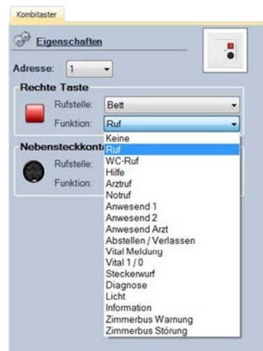
Abbildung 9: Auswahl der Funktion

Mit Hilfe des Dropdown-Menüs neben der Bezeichnung „Funktion“ kann die Funktion ausgewählt werden. Diese Auswahl muss für jede Taste des Tasters separat vorgenommen werden, d.h. handelt es sich z.B. um einen Kombitaster, muss eine Auswahl für die Funktion für die grüne Taste (z.B. „Anwesend1“) und für die rote Taste (z.B. „Ruf“) getroffen werden.